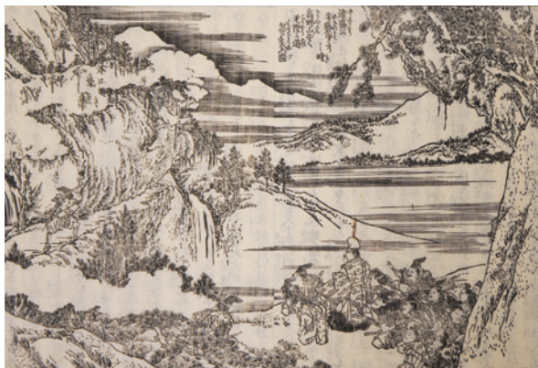
『平家物語図会』巻三