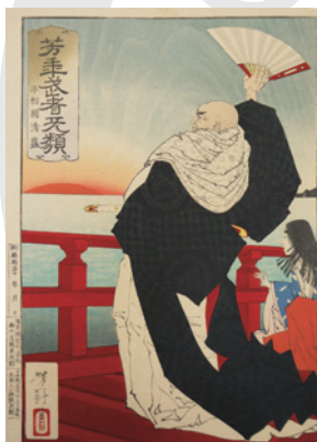
月岡芳年「芳年武者無類 平相国清盛」