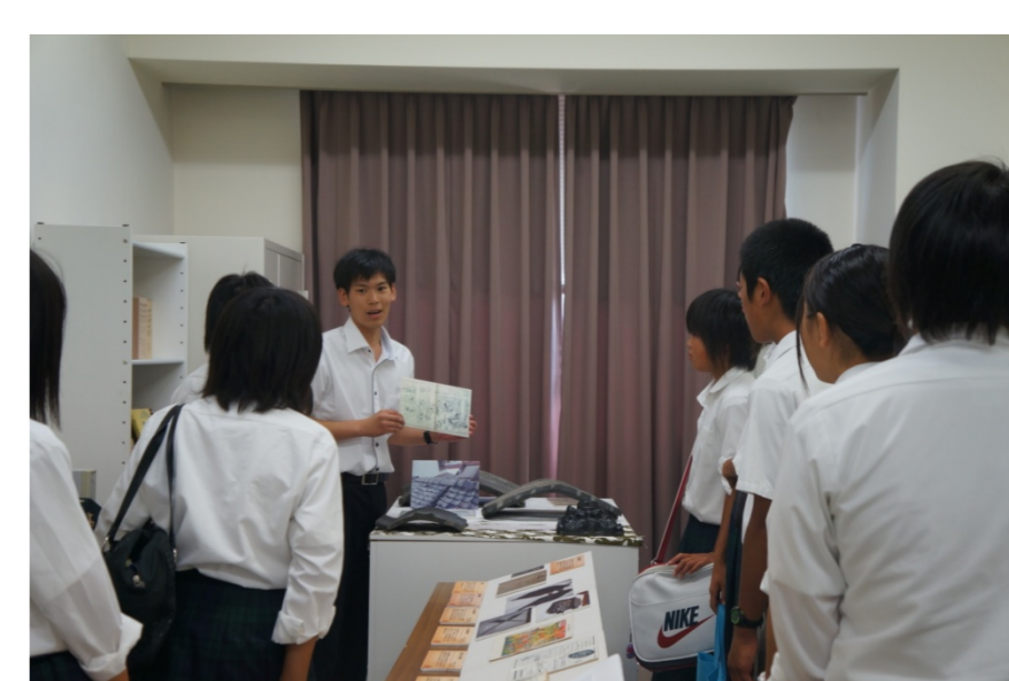
宮島学センター展示室

平成30年度からは、センターが 所蔵する資料(古文書や絵図等) を教材として、 和本リテラシー 、 くずし字解読 、 絵図の読み方 などをテーマとした 高大連携公開講座 や、 高校への出前授業 等を計画しています。実践的な力を身につけながら、世界遺産であると同時に広島県を代表する観光地である宮島に対する理解を深めることができます。