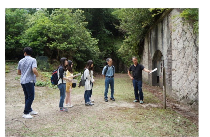
砲台跡でレンガの組みかた調査