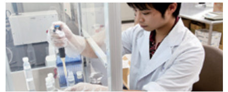
食物の固さや物性を調べる装置で計測したデータを様々な角度から分析する。