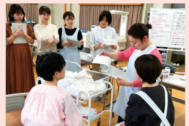
シミュレーションの実施