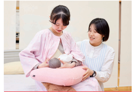
母乳育児支援の演習