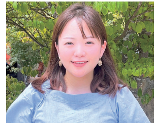
JA尾道総合病院助産師

先生方は、常に私たちが助産師としてどうあるべきか、どんな助産師になりたいかを考えられるような指導をしてくださいました。この大学で助産学を学ぶことができ、本当に良かったと思っています。臨床で忙しい日々が続くと、目指す助産師像を見失いそうになりますが、この1年間を思い出しながら、これからも頑張ります。