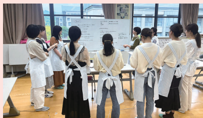
グループでの作戦会議

学生主体のシミュレーション学修を通して、診断力や技術を学び、実践力を養うことができます。