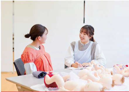
妊婦への健康教育の演習