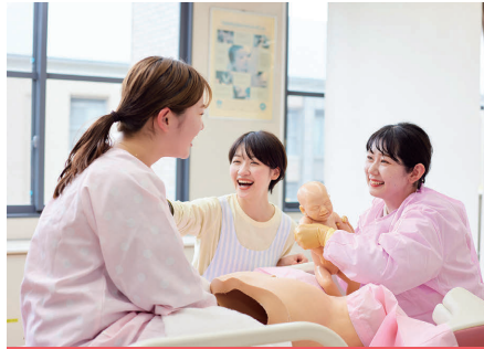
分娩介助技術の演習