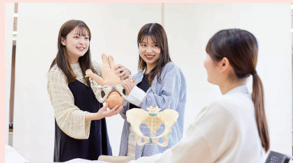
学生同士での学び合い

学修成果のプレゼンテーションや仲間とのディスカッションを通して、批判的思考力・探求心を養います。