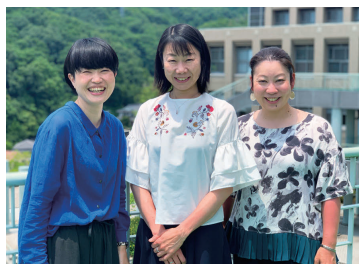
助産学専攻科教員

こんにちは。私たちは、県立広島大学助産学専攻科の教員です。日々、学生みなさんに助産の楽しさを伝えようと奮闘しています。