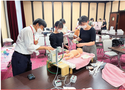
新生児蘇生法の演習

県立広島病院、JA尾道総合病院、市立三次中央病院、広島市立北部医療センター、安佐市民病院、広島市立広島市民病院、広島大学病院、藤東クリニック、姫路赤十字病院、にしだ助産所、三原市保健福祉部など