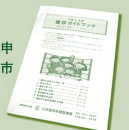
健診の種類や受診料 などわかる虎の巻

※今年度の健診は、9月30日までです ※各地区の特設会場で行う集団健診の受付(今年度分)は終了しています