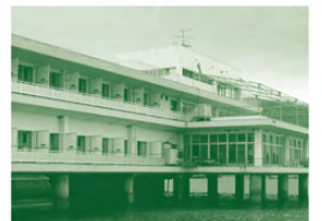
会場になる能美海上ロッジ