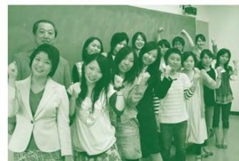
楽しいイベントを考えています

江田島市と県立広島大学の教職員や 学生が一緒になって「健康イベントの 開催」「健康講演会・教室の開催」「健 康に関する調査・研究」など、市民の健 康・長寿に向けたプロジェクトを推進し ています。今後もイベント参加やアンケ ートなど、プロジェクトへのご協力をお 願いします。