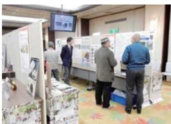
展示ブースの様子

産学官連携商品の展示ブースや試食会場も設置し、来場者の方々との活発な情報交換や交流が行われました。また、別会場では産学官連携商品の試食会も行い、様々な意見をいただきました。こうした意見を産学官連携活動に繋げていきたいと考えています。