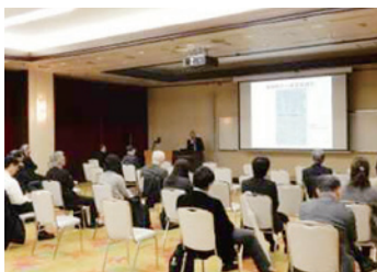
成果発表会の様子

3月4日、サテライトキャンパスひろしまにおいて地域連携成果及び産学官連携研究を紹介する発表会を開催しました。地域連携成果発表会では、地域戦略協働プロジェクト事業、産学官連携商品、公開講座及びクラウドキャンパスシステムの取り組みについて展示・紹介し、産学官連携研究発表会では、3名の教員による自治体や企業と連携した産学官連携による共同研究について発表しました。