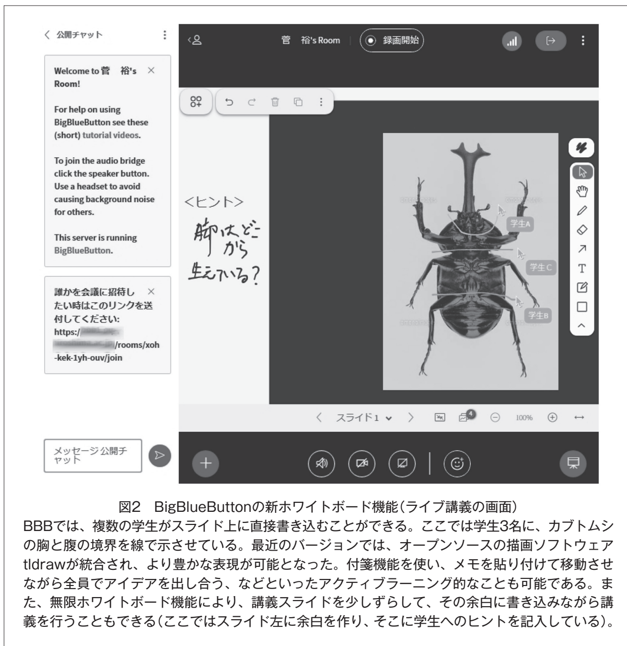
図2 BigBlueButtonの新ホワイトボード機能(ライブ講義の画面)

BBBでは、複数の学生がスライド上に直接書き込むことができる。ここでは学生3名に、カブトムシの胸と腹の境界を線で示させている。最近のバージョンでは、オープンソースの描画ソフトウェアtldrawが統合され、より豊かな表現が可能となった。付箋機能を使い、メモを貼り付けて移動させながら全員でアイデアを出し合う、などといったアクティブラーニング的なことも可能である。また、無限ホワイトボード機能により、講義スライドを少しずらして、その余白に書き込みながら講義を行うこともできる(ここではスライド左に余白を作り、そこに学生へのヒントを記入している)。