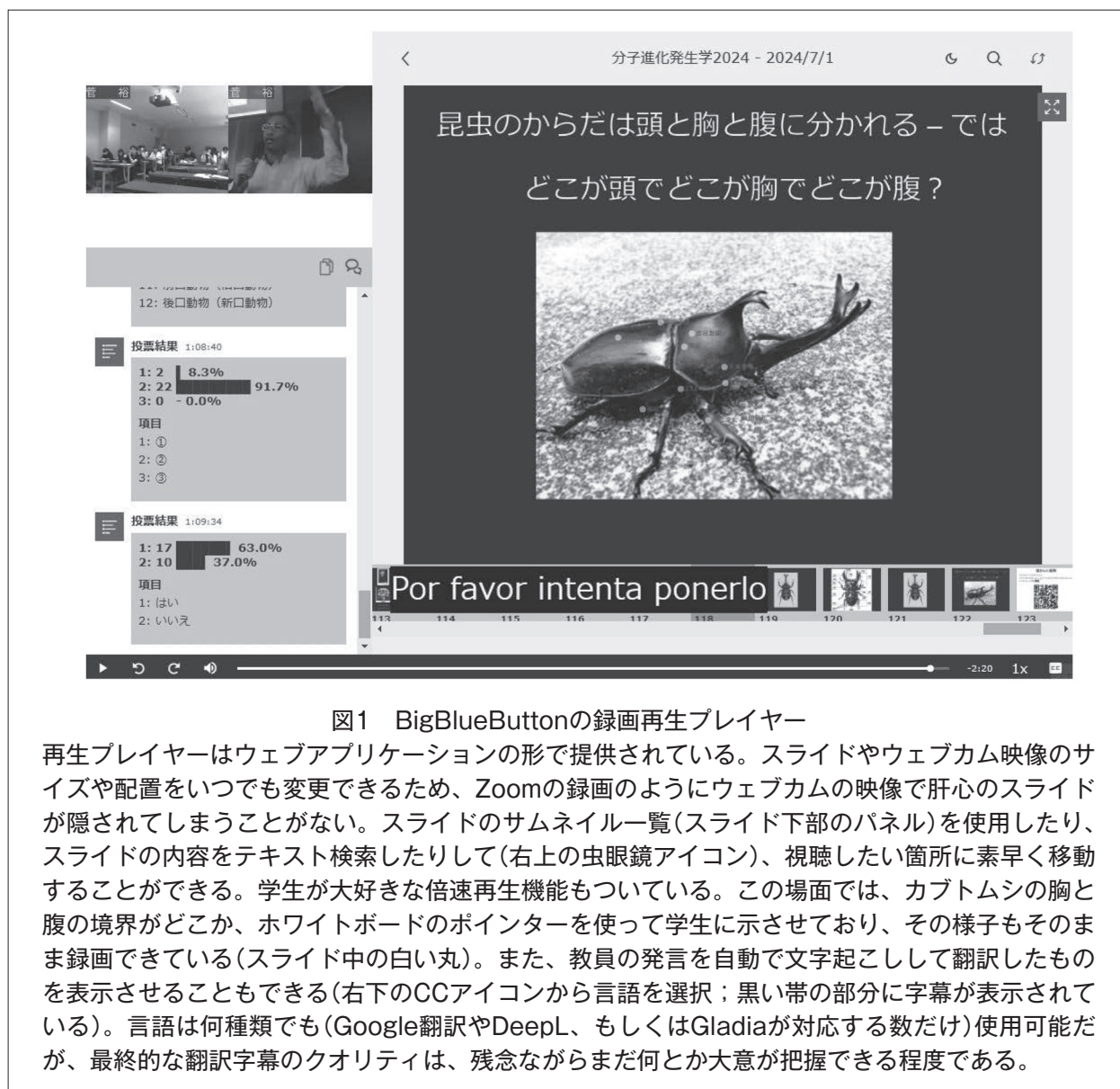
図1 BigBlueButtonの録画再生プレイヤー

再生プレイヤーはウェブアプリケーションの形で提供されている。スライドやウェブカム映像のサイズや配置をいつでも変更できるため、Zoomの録画のようにウェブカムの映像で肝心のスライドが隠されてしまうことがない。スライドのサムネイル一覧(スライド下部のパネル)を使用したり、スライドの内容をテキスト検索したりして(右上の虫眼鏡アイコン)、視聴したい箇所に素早く移動することができる。学生が大好きな倍速再生機能もついている。この場面では、カブトムシの胸と腹の境界がどこか、ホワイトボードのポインターを使って学生に示させており、その様子もそのまま録画できている(スライド中の白い丸)。また、教員の発言を自動で文字起こしして翻訳したものを表示させることもできる(右下のCCアイコンから言語を選択; 黒い帯の部分に字幕が表示されている)。言語は何種類でも(Google翻訳やDeepL、もしくはGladiaが対応する数だけ)使用可能だが、最終的な翻訳字幕のクオリティは、残念ながらまだ何とか大意が把握できる程度である。